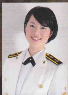
三宅由佳莉 (ソプラノ)