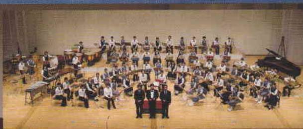
ゲスト：埼玉県中学校選抜吹奏楽団