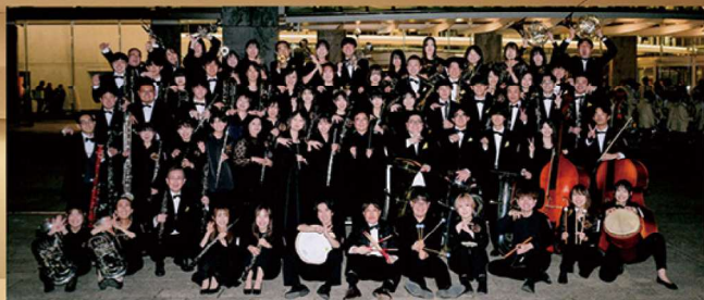
共演 / 川金アンサンブルリベルテ吹奏楽団 第67回定期演奏会