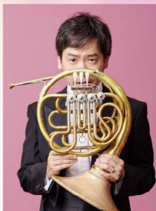
【スペシャルゲスト】