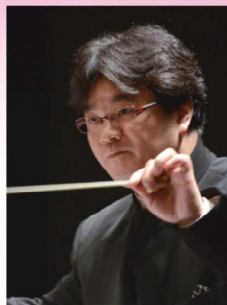
【川金アンサンブルリベルテ吹奏楽団】