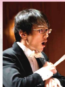
【川金アンサンブルリベルテ吹奏楽団】