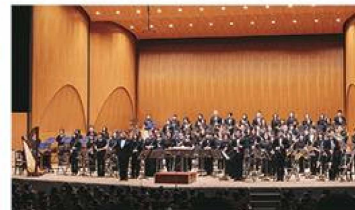
【土気シビックウインドオーケストラ】