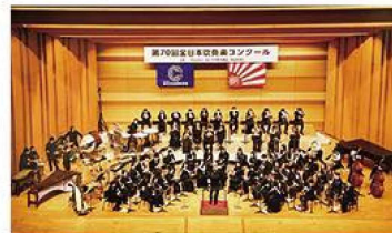
【アンサンブルリベルテ吹奏楽団】