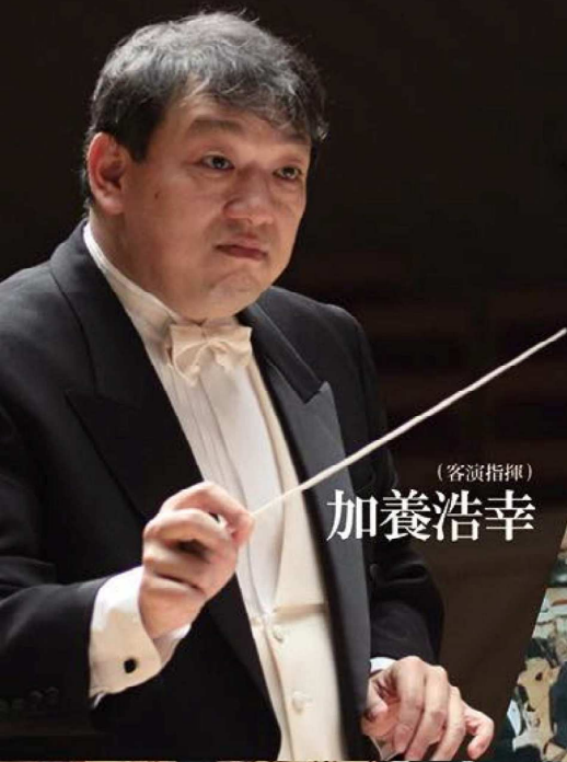
(客演指揮) 加養浩幸