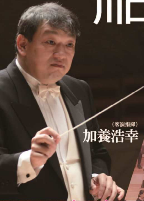
(客演指揮) 加養浩幸