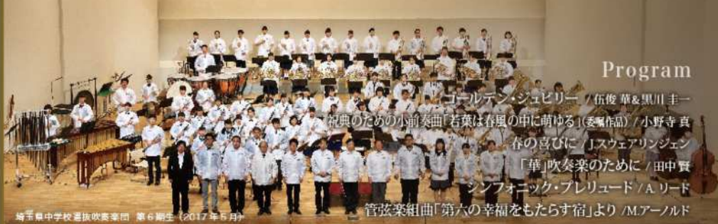
埼玉県中学校選抜吹奏楽団 第7期生 (2017年5月)