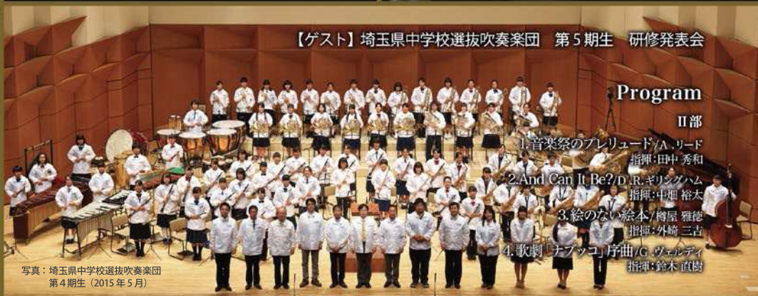
【ゲスト】埼玉県中学校選抜吹奏楽団 第5期生 研修発表会